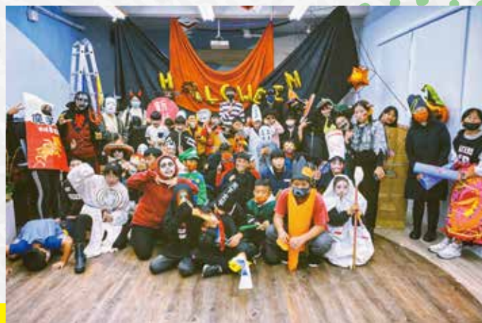
萬聖節一起學英文和展現自我