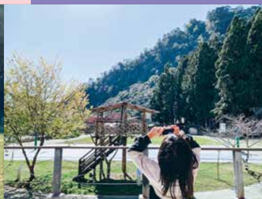
幸運的我們擁有被山林圍繞的校園