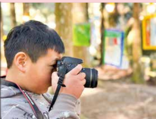
中高年級拿著單眼相機，愈來愈有攝影師的架式