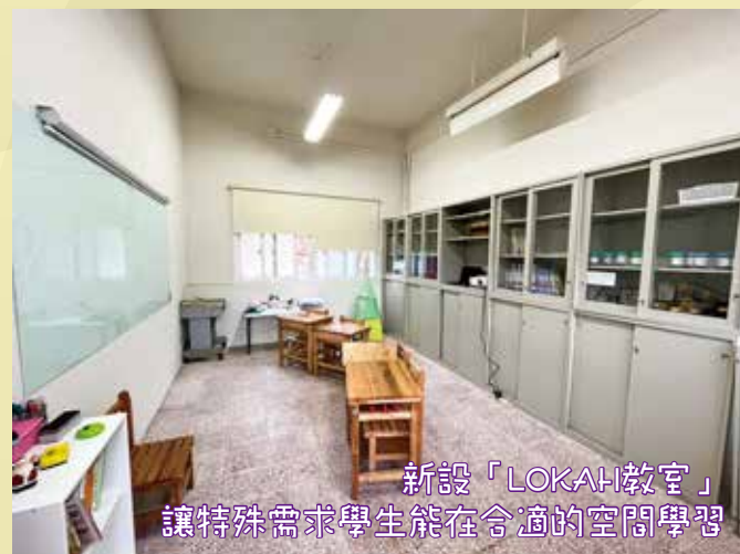
新設「LOKAH教室」 讓特殊需求學生能在合適的空間學習