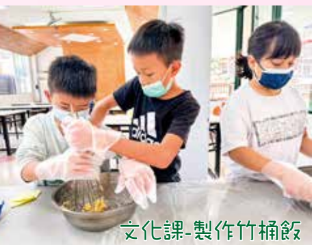
文化課-製作竹桶飯