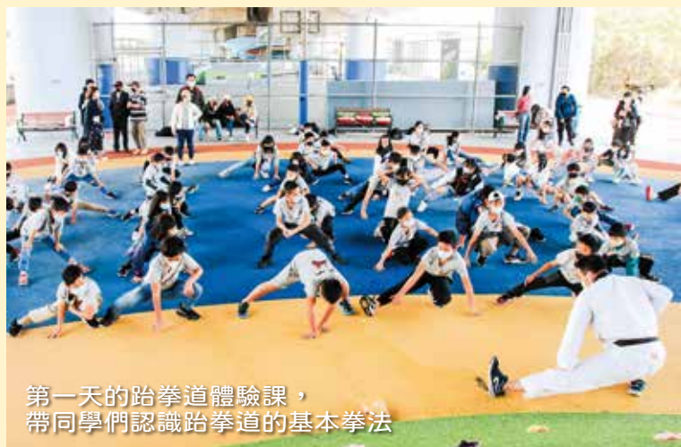
第一天的跆拳道體驗課， 帶同學們認識跆拳道的基本拳法