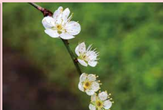
學生鏡頭底下的冬梅