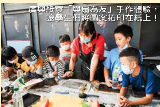
廣興紙寮「與扇為友」手作體驗， 讓學生們將圖案拓印在紙上！