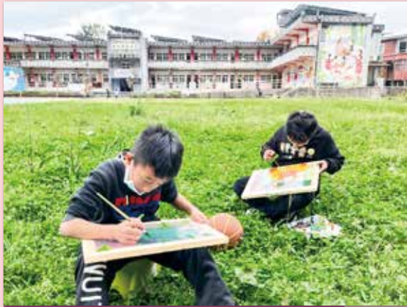
孩子們在藝術展數周前 如火如荼的進行創作

「5、4、3、2、1，新光國小森林畫展～光影藝術節正式開幕！」隨著絢爛的煙火升起，懸在畫作前的燈光一一被點亮，這一晚可以說是森林教室一年當中最熱鬧的夜晚。這學年度的作品別具特色，我們在木頭畫框貼上兩片透明片，營造前景與後景，並利用壓克力顏料，畫出校園中的點點滴滴。每個孩子站在自己的作品旁，有的人帶著膽怯害羞的心情對著陌生人介紹，有的人面對熙來攘往的觀眾侃侃而談，大方介紹自己的畫作內容。這一夜，部落居民們走入校園，一探孩子們在學校的學習生活，一股親情的暖流圍繞在森林教室裡，在寒冬中久久不曾散去。黑夜裡，透出光的顏料色彩斑斕，映在孩子們的臉上。每個小小的內心裡升起的成就感與自信心也打從心底，散發出靈性光采。