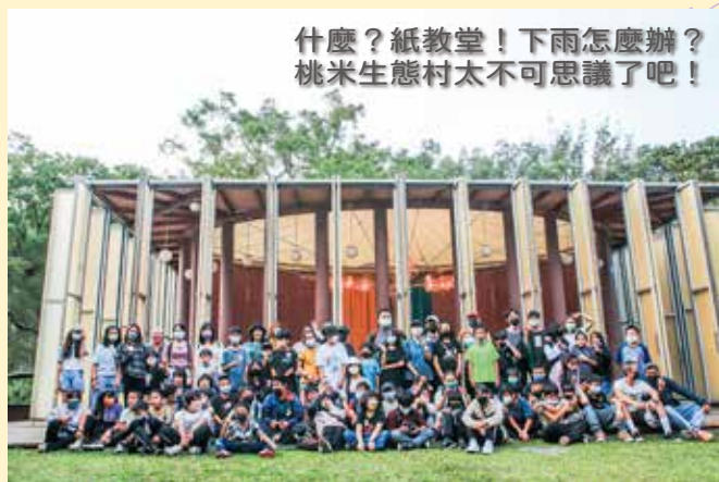
什麼？紙教堂！下雨怎麼辦？ 桃米生態村太不可思議了吧！