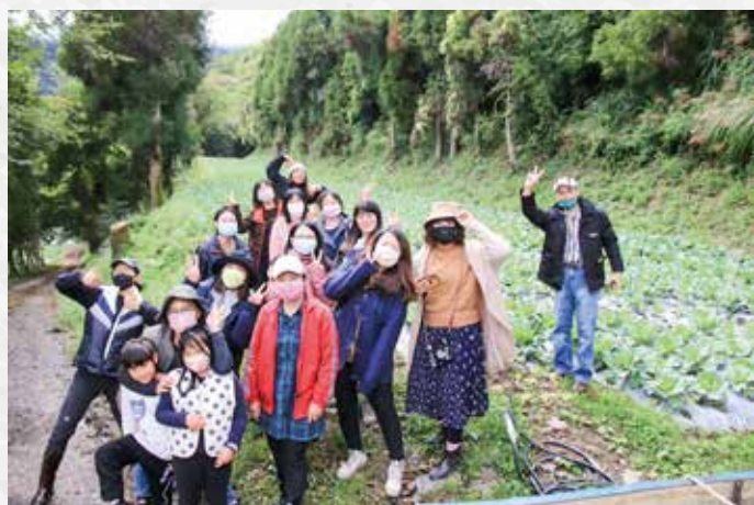
教師團隊的山野踏查與學習