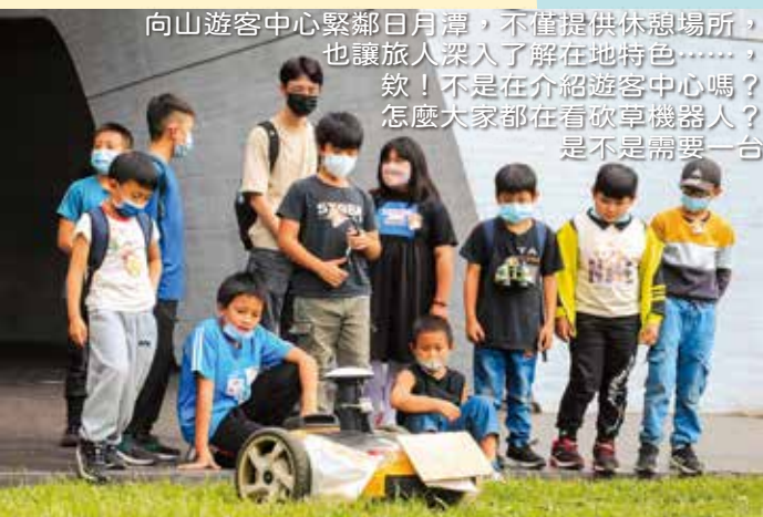
向山遊客中心緊鄰日月潭，不僅提供休憩場所，也讓旅人深入了解在地特色……欸！不是在介紹遊客中心嗎？怎麼大家都在看砍草機器人？是不是需要一台

戶外教育出發囉！身為新竹縣最「高」學府的新光國小，每次出門都是大工程呢！所以一定要努力地玩，用力地學，帶著滿滿的收穫回來。三天的戶外教育行程，第一天有動動身體的跆拳道體驗課程、海山運動公園跑跳，讓學生活動筋骨的同时，也可以認識不同的體育項目。第二天帶大家走訪九族文化村、桃米生態村、向山遊客中心，體驗各地的生態、文化。最後一天，我們前往參觀車埕火車站，並在廣興紙寮動手DIY，製作手工紙扇，與導覽員一起認識手工紙的製作過程。讓我們一起透過照片，回顧這趟豐富又有趣的學習之旅吧！