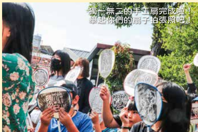
獨一無二的手工扇完成啦！ 舉起你們的扇子拍張照吧！