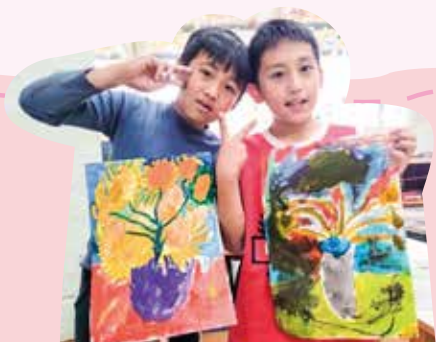
同樣的繪畫主題，每個人都能展現自己獨特的風格