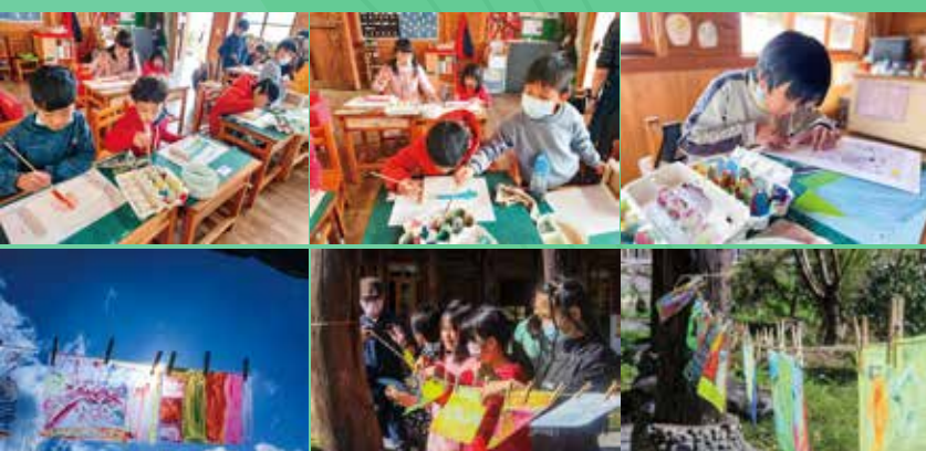
全校課——沙龍老師書畫課