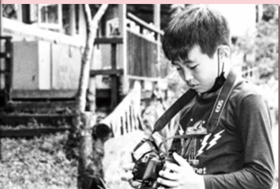
黑白影像讓畫面更加純粹