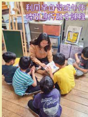
利用早自習或午休 時間進行融合課程