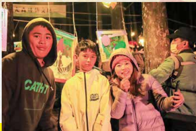
用「美」拉進我們的距離