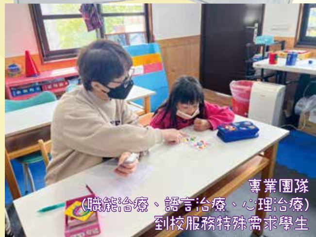
專業團隊 (職能治療、語言治療、心理治療) 到校服務特殊需求學生