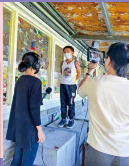
鏡頭前發表創作心路歷程