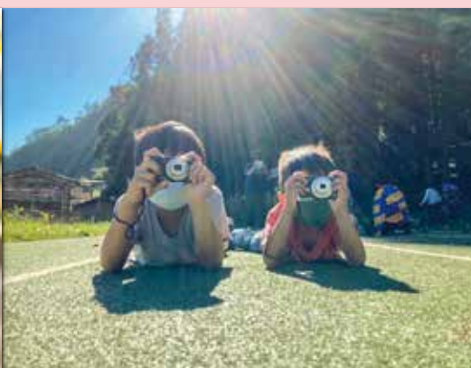
低年級的孩子以小相機開始摸索相機的操作