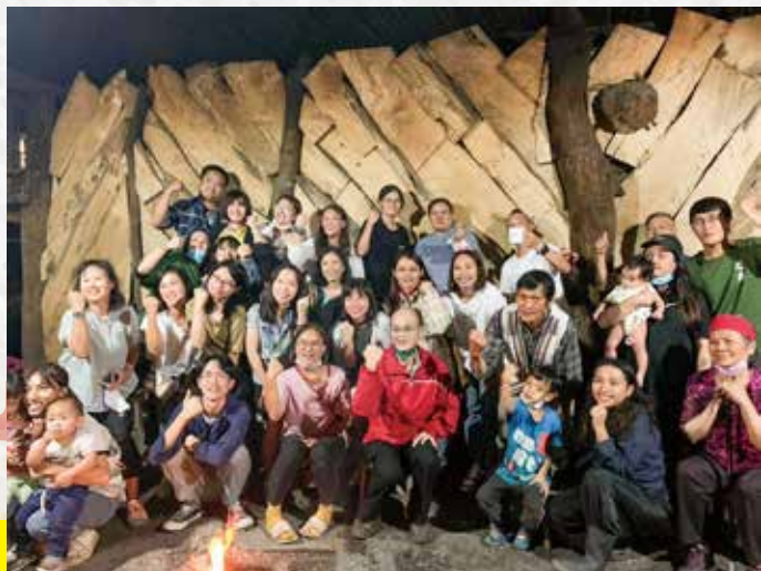
教師夥伴的泰雅文化增能

教導處以「美一座山林，培育永續創新的薪泰雅之子」為願景，期望能讓孩子習得核心五力：學習力、創意力、實踐力、表達力、鑑賞力。配合部定的領域課程、校訂文化課程與讀寫課程，我們共同傳承泰雅文化，培養Tayal軟實力。在教育部雙語政策的推動下，本校除了培養學生的英語能力，也提升對英語與國際文化的興趣。校內既有的英語課和國際教育課，也配合萬聖節舉辦創意服裝大賽。另於晨會時間讓小朋友進行英語讀者劇場發表，週五下午也和美國普利西學校交流，分享英語自我介紹和介紹小遊戲。