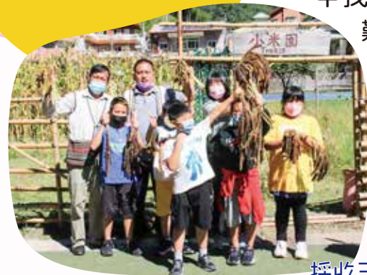
採收三年級時種的小米

櫻花飄飄，樹影搖搖，四甲的孩子們嘰嘰喳喳快樂的像是枝頭的畫眉鳥，在新光燦爛中逐漸成長，成長為更好的自己。這一年之中我們一起經歷了豐富的旅程，戶外教育時迎著南方的艷陽恣意歡笑，徜徉於文學之海編織自己的船帆，乘數學之風躍上愈來愈陡的高樓，隨著叮叮咚咚的樂音舒展身姿，絞盡腦汁於遊戲中找出最優解。最獨特可愛的四甲，創造最難忘可貴的回憶。水蜜桃即將成熟，我們也要升上五年級了，將要成為學校裡的大哥哥大姊姊。未來的課業也許會更艱難，但我們一定可以克服的！