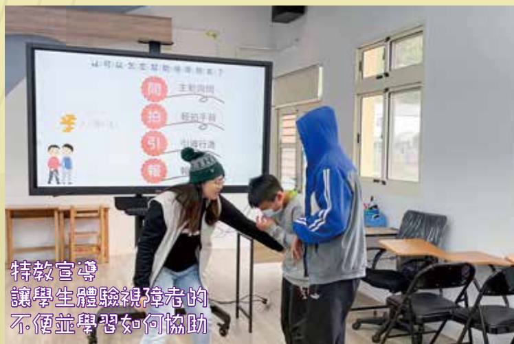
特教宣導 讓學生體驗視障者的 不便並學習如何協助