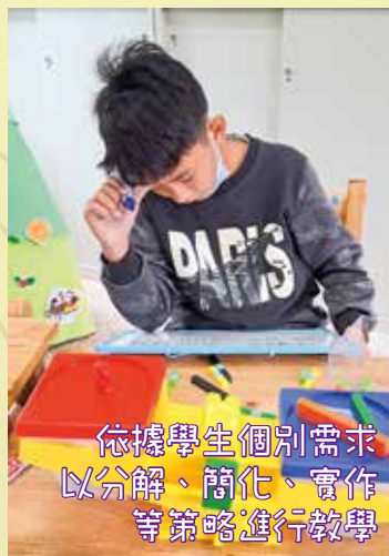
依據學生個別需求 以分解、簡化、實作 等策略進行教學