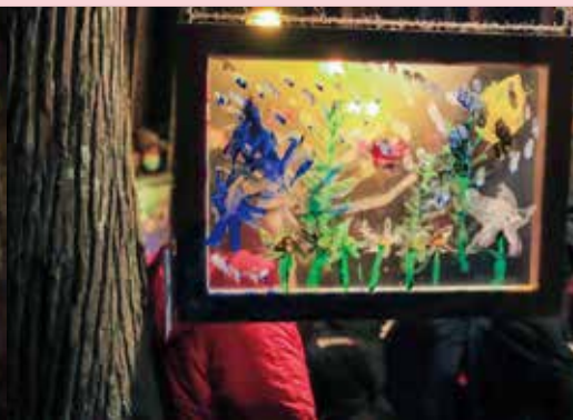
顏料與光線在透明的畫布 上交織出美麗的樣貌