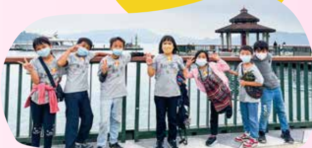
戶外教育-南投日月潭