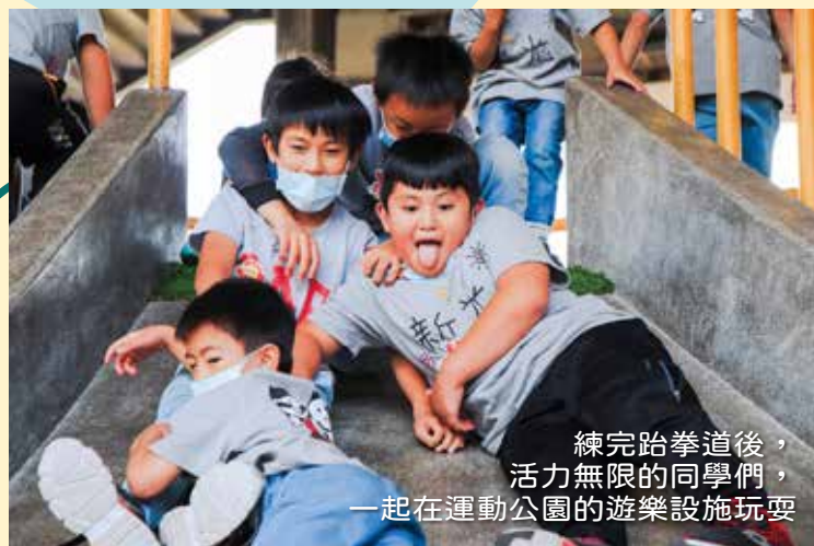
練完跆拳道後， 活力無限的同學們， 一起在運動公園的遊樂設施玩耍