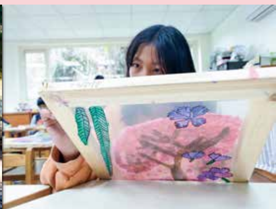
作品在認真的眼神中 逐漸成型