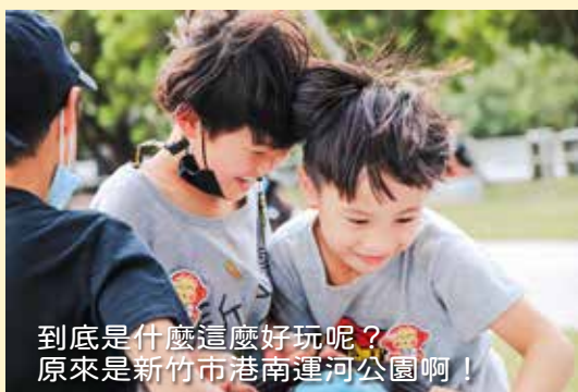
到底是什麼這麼好玩呢？ 原來是新竹市港南運河公園啊！