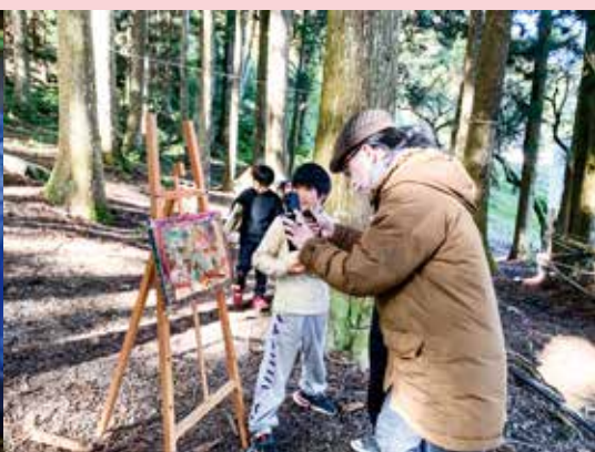
展覽背後的大推手— 沙沙老師為每個孩子錄製 作品解說短片