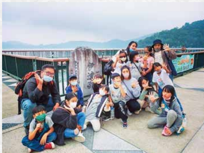
戶外教育加強團隊合作精神 並拓展學習視野