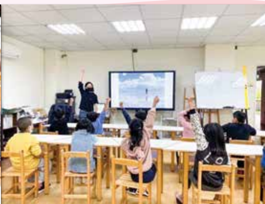
老師精心設計課程，孩子踴躍參與，是課堂中最美的風景