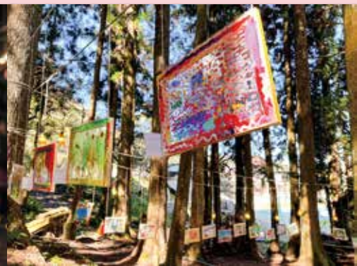
白天的陽光帶來另一種 朝氣蓬勃的氛圍