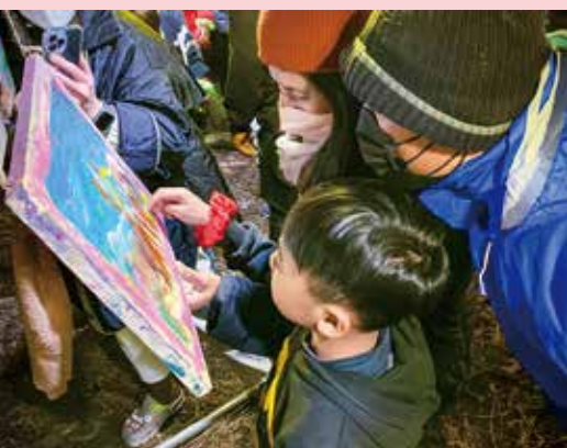
藝術展上處處可以看見 家長們驕傲欣慰的神情