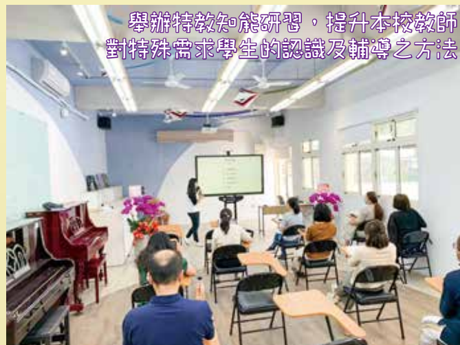
舉辦特教知能研習，提升本校教師 對特殊需求學生的認識及輔導之方法

111學年度開始，新光國小新增了兩位特教老師，為有特殊需求的孩子們提供學業、情緒及社會技巧的相關課程與其他服務，我們將班級命名為「Lokah班」，期望能在學校中，為特殊需求的孩子們提供一個加強能力、得到鼓勵及充電的地方。每學期我們協助申請並安排專業團隊治療(職能、語言、心理)，由專業的治療師提供各項訓練建議與處理策略；除此之外也規劃給孩子們的特教宣導，期望透過各種體驗活動，讓孩子們認識身心障礙者，並培養尊重與同理的態度。未來若對於特教相關資訊的疑問，歡迎各位師長和特教老師一起討論，也歡迎各位小朋友來和我們一起學習唷！