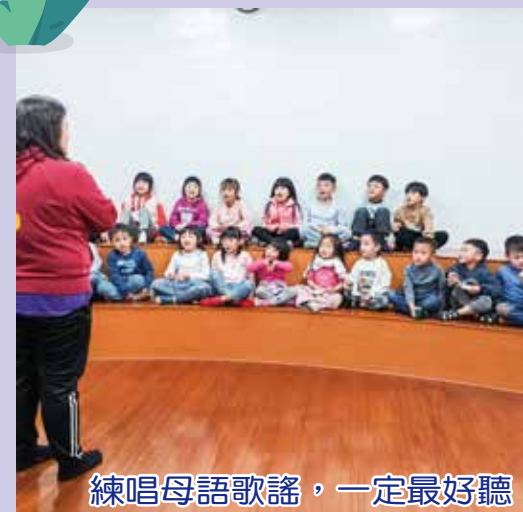
練唱母語歌謠，一定最好聽