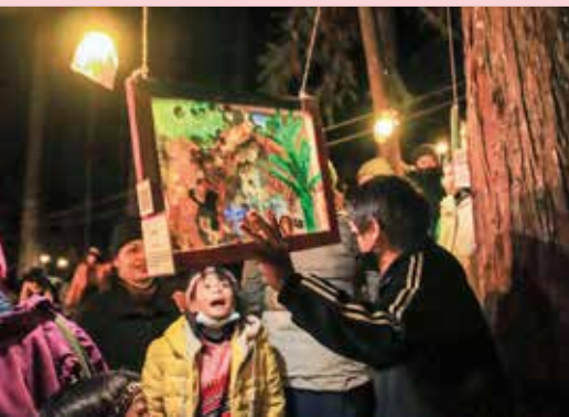
新光與司庫的孩子們 生動活潑的互相交流