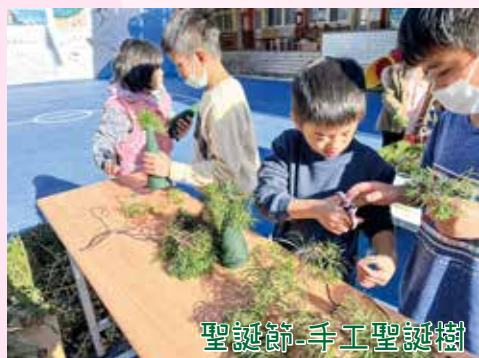
聖誕節-手工聖誕樹