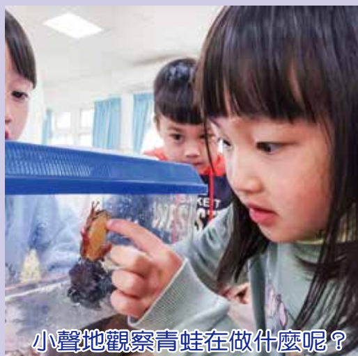
小聲地觀察青蛙在做什麼呢？